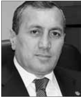
ՍՈՒՐԵՆ ԽԱՉՆԱՅՐՅԱՆ Սյունիքի մարզպետ

Սիրելի՛ սյունեցիներ Պատմության գիրկն է անցնում 2015 թվականը: Կարծում եմ՝ անցնող տարին մեզ համար բարենպաստ տարի էր. 2015 թվականին մեզ հաջողվեց բավականին աշխատանքներ կատարել, մենք կարողացանք կառուցել, բարելավել ու նորոգել առողջապահական կենտրոններ, դպրոցներ, մանկապարտեզներ, զգալի աշխատանքներ իրականացնել ճանապարհաշինության մեջ: Մի խոսքով՝ 2015 թվականին մեզ հաջողվեց անել հնարավորը՝ լուծելու մեր առջև դրված առաջնահերթ խնդիրները: Համոզված եմ,